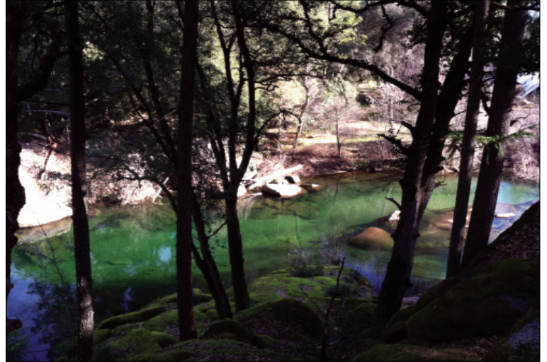
El agua para el área de servicio de Outingdale se desvía del Middle Fork del Río Cosumnes

Las reuniones de la Junta de Directores del Distrito de Riego El Dorado son abiertas al público y generalmente se llevan a cabo los segundos y cuartos lunes de cada mes. Las reuniones comienzan a las 9:00 A.M. en el edificio principal de Placerville ubicado en 2890 Mosquito Road. Visite www.eid.org para obtener más información.